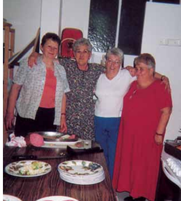
La présidente entourée de bénévoles qui préparent les repas.

La saison 2004/2005 ouvre le 13 septembre pour les convives (inscriptions le vendredi 10 de 17 à 19 heures).