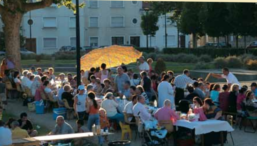
Repas de quartier du 18 juin 2005.

LE JOURNAL DU QUARTIER N°10 SEPT.-OCT.-NOV 2005